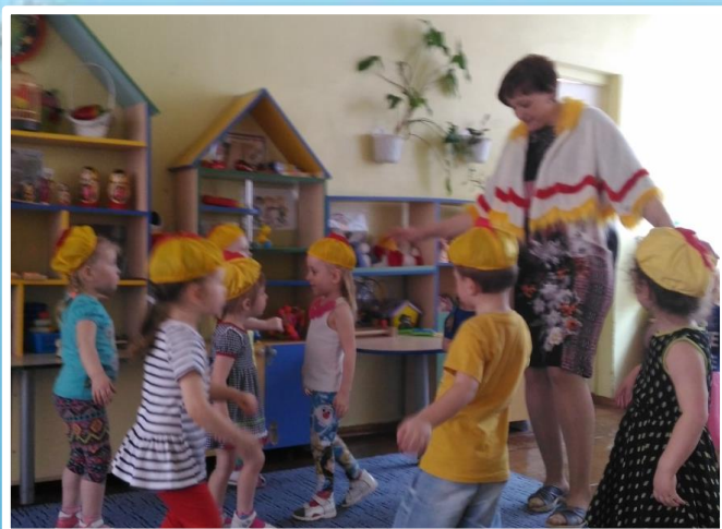
П/и «Вышла курочка гулять»