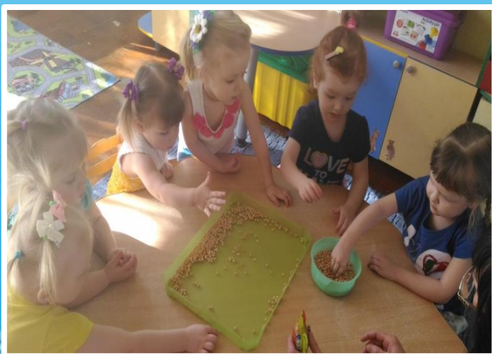
Д/И «Петушка я накормлю, дам я зернышек ему»