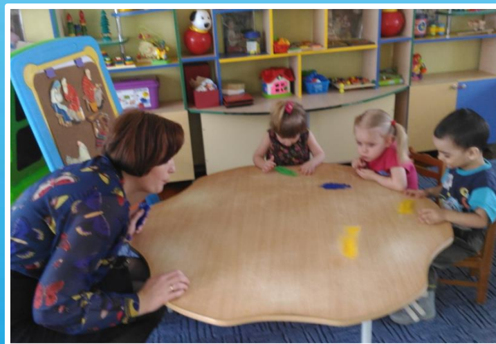
Поддувание – упражнение на развитие речевого дыхания