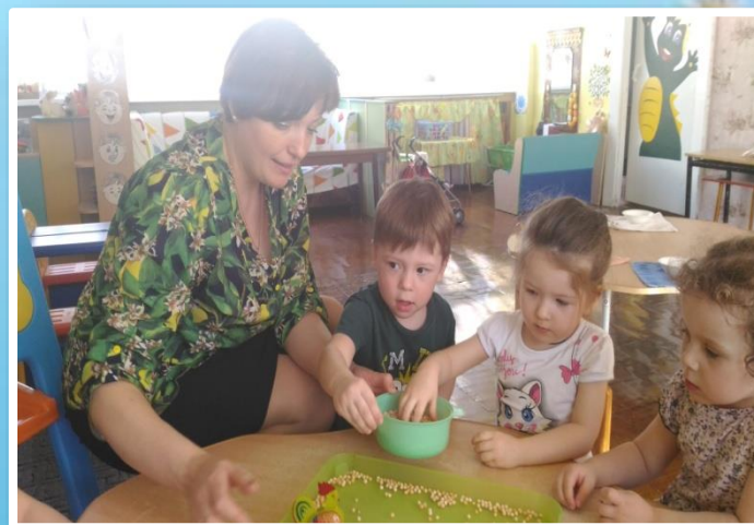
Пальчиковая игра «Петушок»